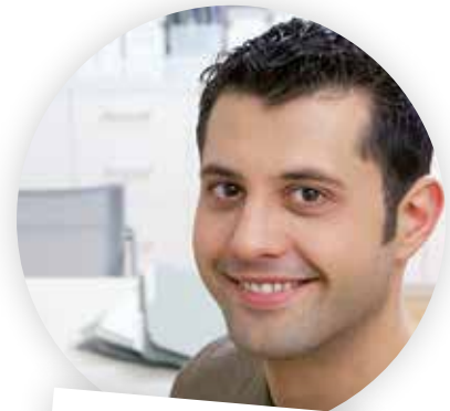
... im Backoffice

Einfach spitze: Das schnelle Erfassen von Adressen per Drag&Drop aus Outlook und aus den Impressumsangaben der Webseiten.“