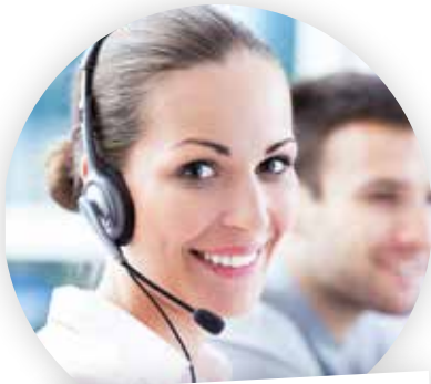
... im Kundenservice

„Bei meiner Arbeit steht der Servicegedanke an erster Stelle. Mit Adress PLUS kann ich Kunden und Interessenten schnell und flexibel weiterhelfen, weil alle Informationen, auch aus anderen Abteilungen, immer aktuell verfügbar sind. Hier arbeitet jeder Hand in Hand. Das merken unsere Kunden und sind begeistert.“