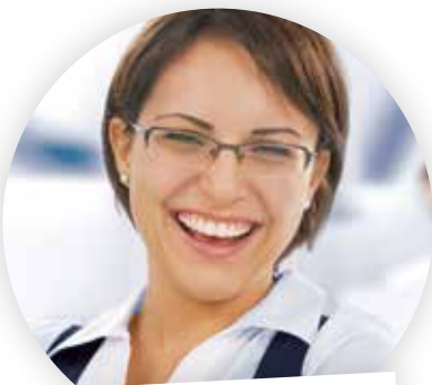
... im Marketing

„Mit cobra gehen mir Marketingaktionen ganz einfach von der Hand. Ich selektiere die genaue Zielgruppe im Handumdrehen und nutze dann die cobra Funktionen für personalisierte E-Mails, tolle HTML-Newsletter und portooptimierte Serienbriefe.“