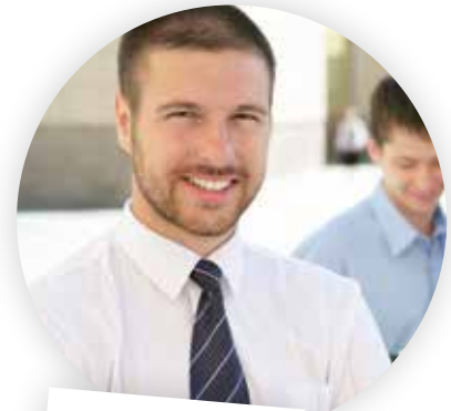
... im Vertrieb

Mein persönliches Highlight: Ich kann Kunden und Interessenten nach bestimmten Kriterien ganz spontan selbst selektieren. Damit ist die Akquise viel effizienter.“